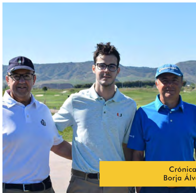
Crónica de: Borja Álvarez