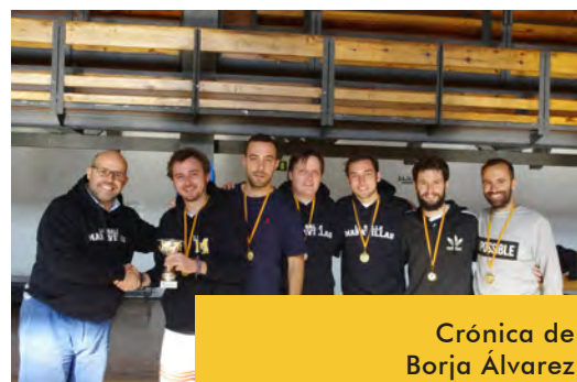
Crónica de Borja Álvarez