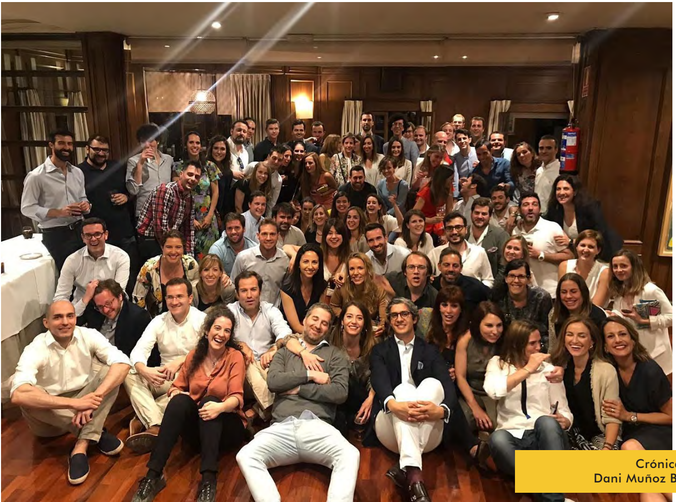
Crónica de Dani Muñoz Beret